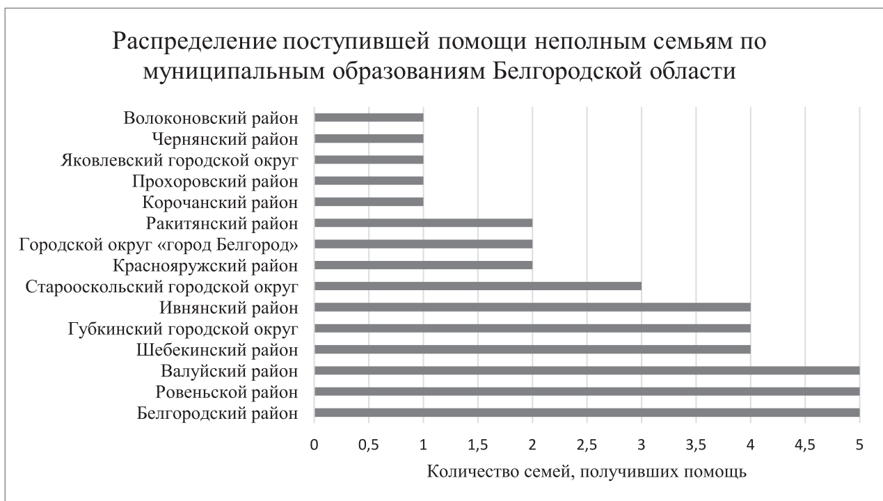
Рис. 2. Распределение поступившей помощи неполным семьям по муниципальным образованиям Белгородской области