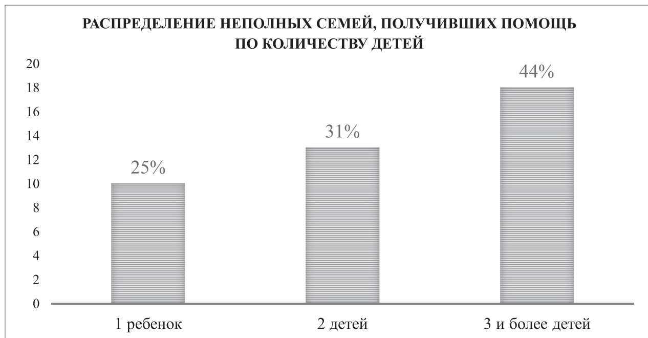
Рис. 3. Распределение неполных семей, получивших помощь по количеству детей

Если посмотреть на участников благотворительной программы «Ты не один» на территории Белгородской области, которым уже поступила благотворительная помощь, то это в большинстве семьи, где воспитывается 3 и более детей. В 2023 г. впервые за все время реализации программы в нашем регионе помощь была оказана отцу-одиночке, воспитывающему самостоятельно 7 детей (рис. 3).