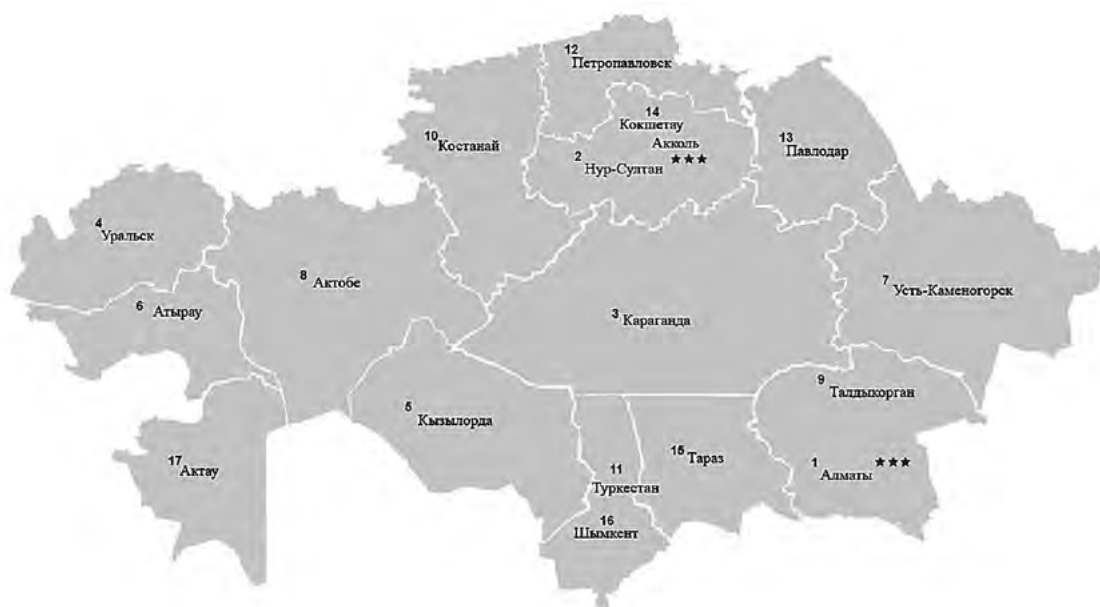
Рис. 1. «Умные города» Республики Казахстан [4]

В 2019 г. был внедрен Эталонный стандарт «умных городов» Республики Казахстан, который отражает важнейшие критерии отнесения города к данной категории [10]. В 2020 г. вышел рейтинг, отражающий соответствие городов данному стандарту, и наиболее привлекательным для цифровых кочевников стал город Алматы, как показано в таблице 1.