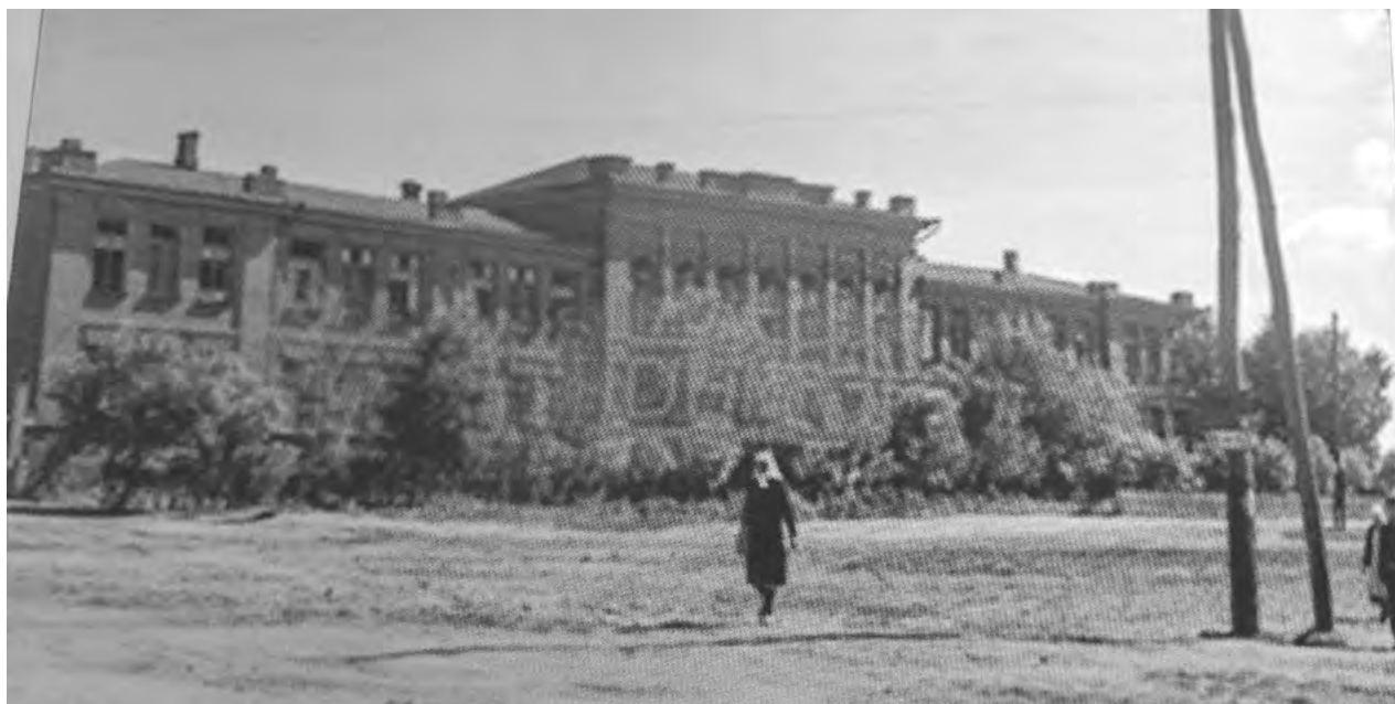
Рис. 5. Больница в г. Белгороде. Дата – не позднее 1943 г.