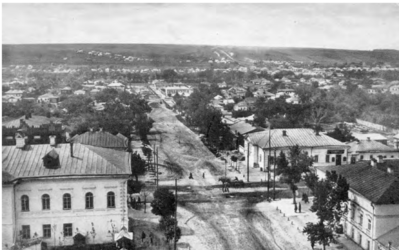
Рис. 1. Перекресток ул. Корочанской и ул. Магистратской (справа – бывшее здание земско-городской больницы).

Во второй половине XIX в. в эпоху великих реформ в стране управление медициной в уезде и городе было передано земству, которому разрешалось преимущественно в хозяйственном отношении «попечение о народном здравии и благотворительных учреждениях». Согласно «Положению о земских учреждениях», получившему силу закона с 1 января 1864 г., это относилось к необязательным