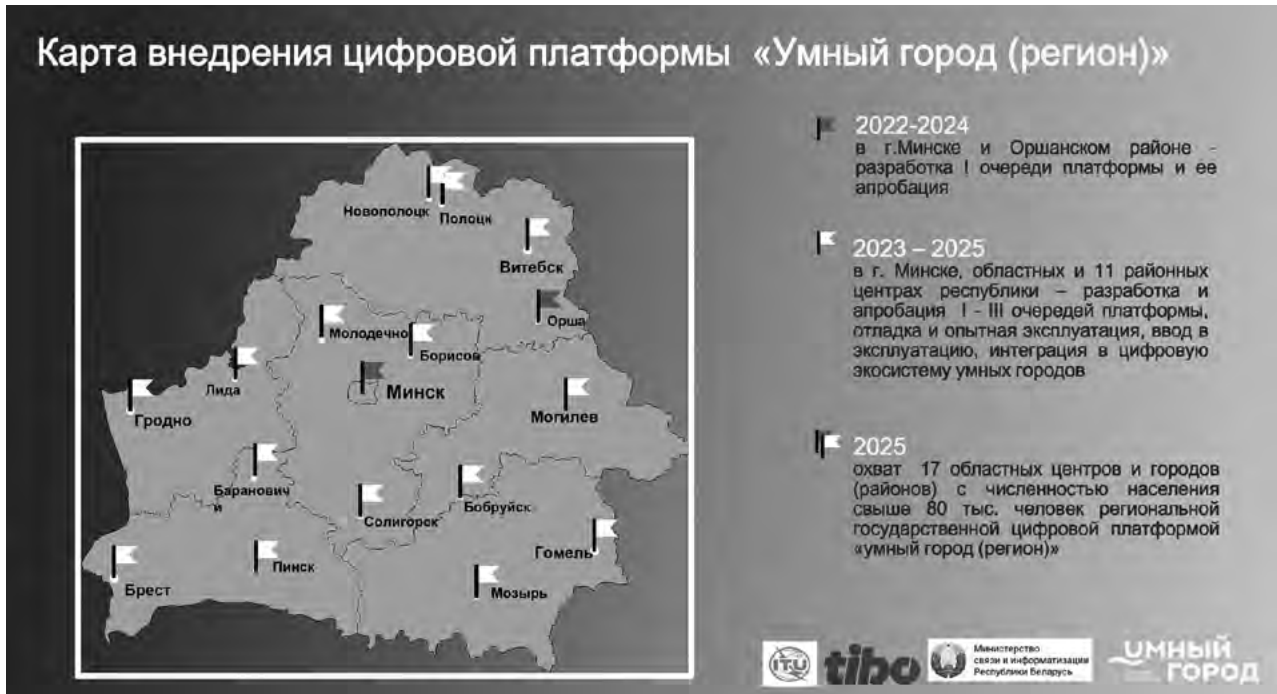
Рис. 2. Карта внедрения цифровой платформы «Умный город» [7]

города, упрощает взаимодействие граждан с органами власти и выступает в качестве дополнительного средства связи с населением и инструмента оказания услуг населению. Полоцк и другие города, охваченные данным проектом, как показано на рисунке 2, могут стать привлекательными для цифровых кочевников.