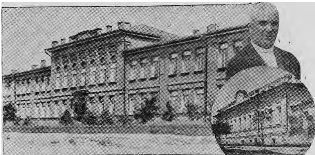
Рис. 4. Фото здания больницы из книги Крупенкова А.Н. «Проидемся по старому Белгороду» с фрагментом старого здания больницы [17]

Сейчас медицинское обслуживание в Белгороде – это сеть учреждений, оснащенных современным медицинским оборудованием и имеющих штат высококвалифицированных врачей. Однако истоки его были заложены в организации земств – органов местного самоуправления в стране, которые были напрямую заинтересованы в благосостоянии своего народа, его здоровье и образовании. Здание Белгородской городской больницы, расположенное на Народном бульваре, предназначавшееся изначально для просвещения народа, уже целое столетие служит не менее гуманному и благородному делу – делу охраны здоровья.